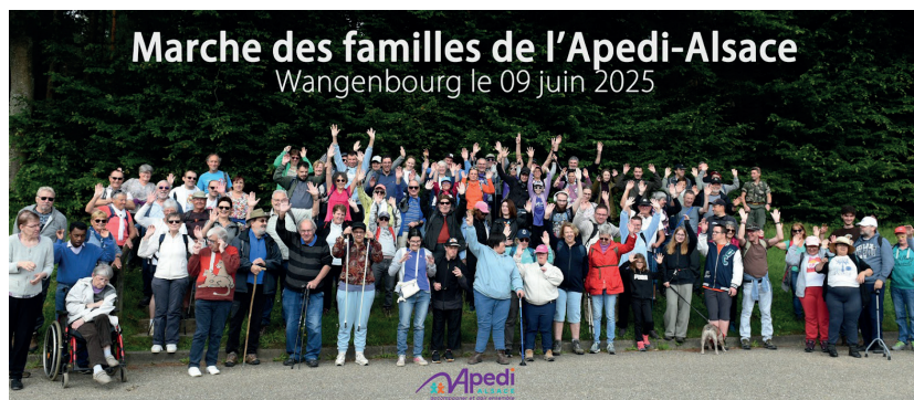
Balade à Wangenbourg