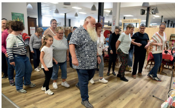
Après la balade à la ballastière de Bischheim