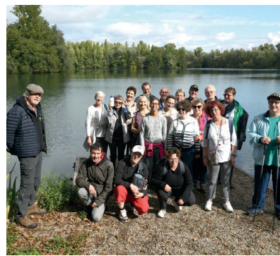
Balade à la ballastière de Bischheim